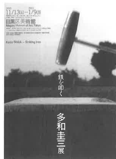
A 4 チラシ

* その他、会期中にギャラリートツアー(4回)および会場内特設上映場で映画「死なない子供、荒川修作」を上映(11月19日(金)・20日(土))