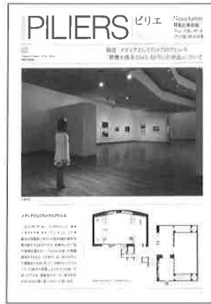
ピリエ NO.25, 26号