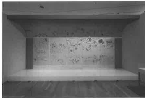
会場風景