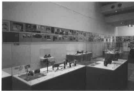
会場写真