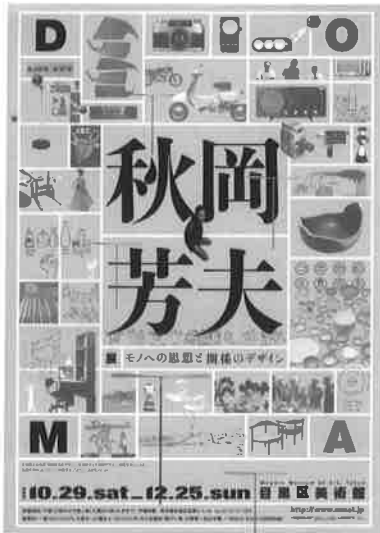
A 4 チラシ

岩本恵美「大人も夢中になる竹とんぼ」美・博ピックアップ 『朝日新聞』2011年11月16日 岸桂子「メカから竹とんぼへ」@展覧会 秋岡芳夫展 『朝日新聞』2011年11月22日夕刊 宝玉正彦「のこぎり、金づち・・・配置の妙」文化 『日本経済新聞社』2011年11月23日朝刊 日野明子「あぐらOK 日本男児の椅子」いま風 ごほうび『読売新聞』2011年12月5日 川上典季子「手の復権を訴えた デザインの先駆者」ART 『PEN』阪急コミュニケーションズ 2011年12月 no.304 「秋岡芳夫の竹とんぼDAY S」Stardust『芸術新潮』新潮社 2012年1月 no.745 高橋美礼「現代デザイナーの先駆者 秋岡芳夫の仕事を振り返る」『いけ花瀧生』瀧生華道会 2012年1月 no.621 井上典子「いまこそ求められる、秋岡芳夫のまなざし」『コンフォルト』2012年2月 no.125