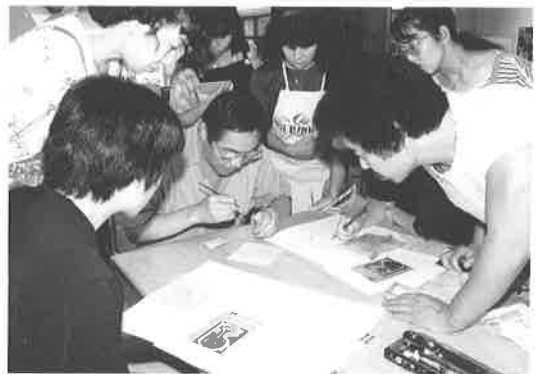
おとなのためのワークショップ