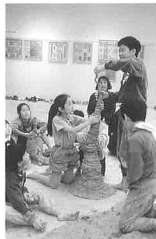
こどものためのワークショップ

サラサラの土から粘土がどのようにできるかを体験した。自分達でつくった粘土で、全身どろんこになりながら、「高いものづくり」「長いものづくり」「壁のぬりこめ競争」などを行い、楽しい土の造形を行った。