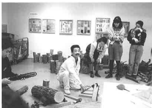
おとなのためのワークショップ