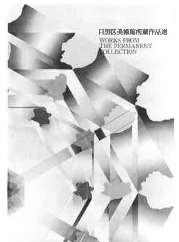
目黒区美術館所蔵作品選