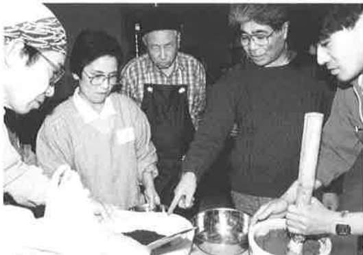
おとなのためのワークショップ

同時開催の安原喜明展に関連させ、作品鑑賞と焼き物の実制作を行った。“掻き落とし”技法で陶板を作成し、土こねから焼成までの工程を体験した。