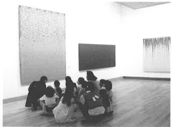
こどものためのワークショップ