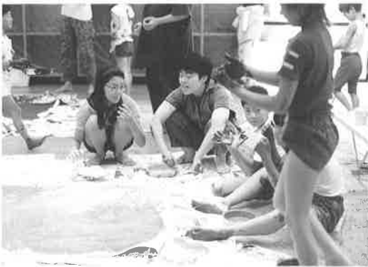
こどものためのワークショップ