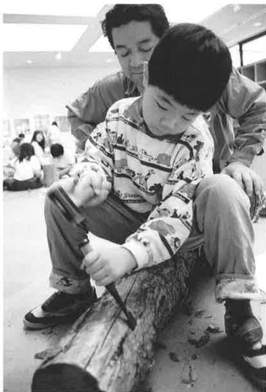
こどものためのワークショップ