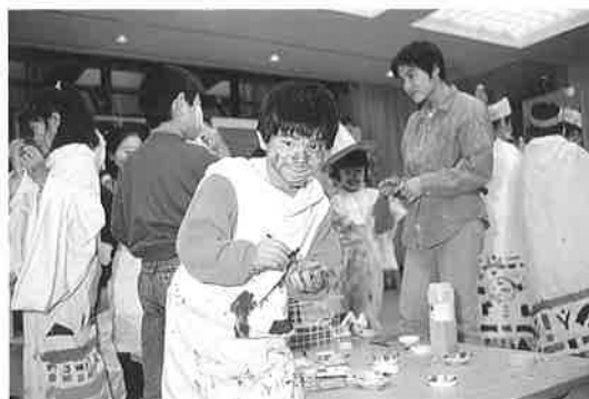
子どものためのワークショップ