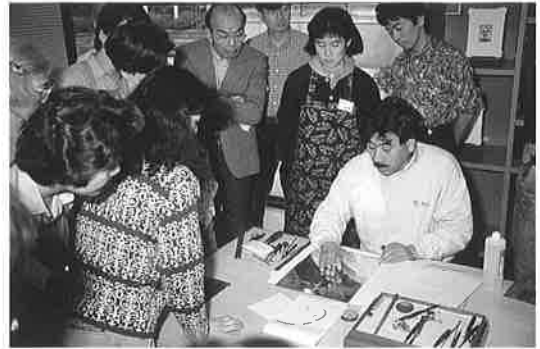
おとなのためのワークショップ