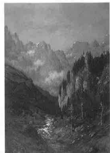
目黒区緑化都市宣言記念展