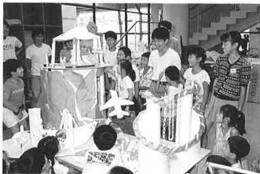
こどものためのワークショップ