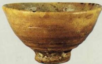
「大井戸茶碗 銘 喜左衛門」(京都、孤蓬庵蔵)[国宝]