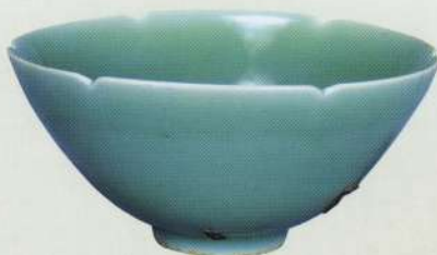
「青磁茶碗 銘 馬殿絆」(東京国立博物館蔵)[重要文化財]