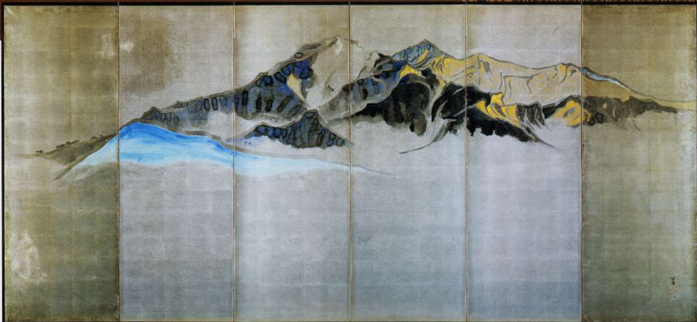
小堀宗慶「磐梯山と秋元湖」(六曲一双屏風、部分)

茶道を極め、優れた目利きとしての小堀宗慶二九三年生雅号紅心にゆかりの深い茶碗「喜左衛門井戸」(国宝)など古美術の名品、そして自ら創作した日本画や書、工芸など