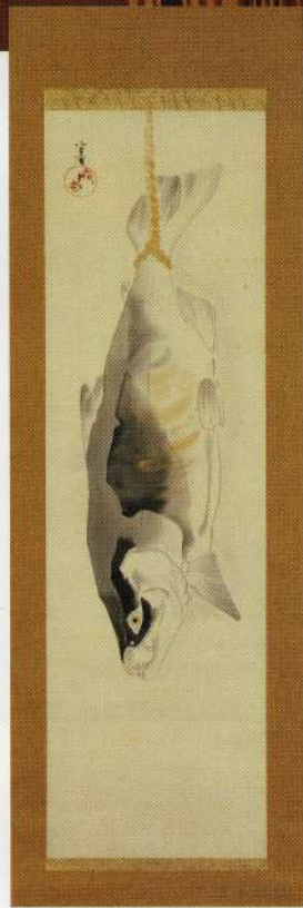
小堀宗慶 「歳暮」(南部鼻曲り鮭)