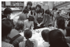
写真:2012年のワークショップより