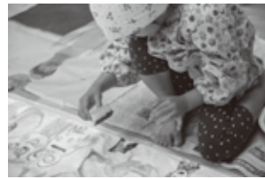
写真:2018年のワークショップより

○顔を真っ白に塗ると、現れるもう一人の自分、カオカオ星人。今回はさらにバージョンアップしてニューカオカオ星人になります！そして、いつもとは違う自分に变身して、身体をいっぱい動かしながら作品を楽しみます。子どもの頃、目黒区美術館のワークショップに参加していたメグロアソビ冒険隊と一緒に、美術館で思い切り遊みましょう。